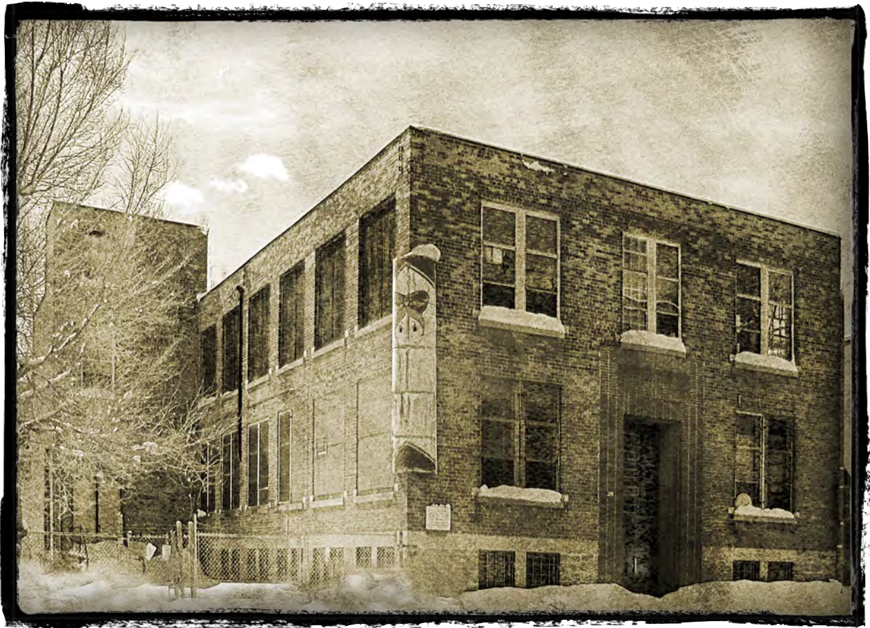
2220, rue Parthenais, Montréal (Québec)